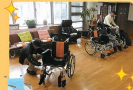
各階の車椅子を一台一台丁寧に 清掃していただきました

十二月十日、熊本県年金受給者協 会 宇城市部会の方々が十六名来荘 され、車椅子を清掃していただきま した。感謝申し上げます。