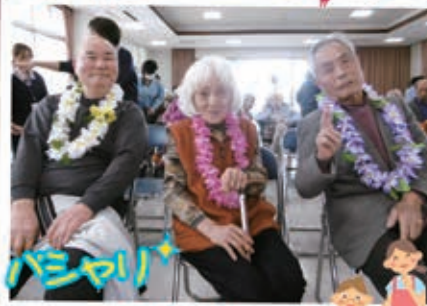
素晴らしい 歌声を披露しました