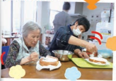
絵も柄くように 盛り付けていきます