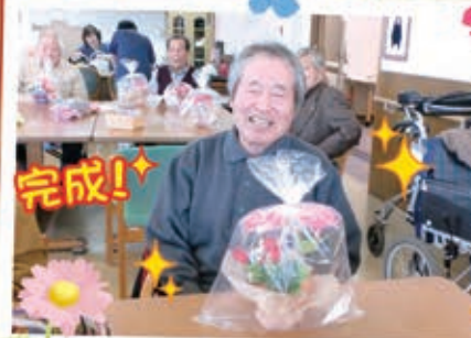
見事完成しました。 アロマな香りが安らぎます