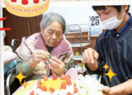
イチゴの赤色が映えまあね♪ 勿論、味も最高でした