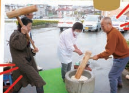
お正月に向けてベッタン餅つき♪ 完成まであと少し!