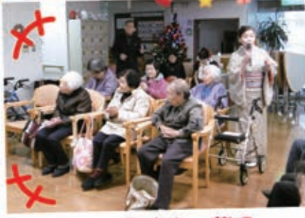
美しい歌声と一緒に みんなで歌いました