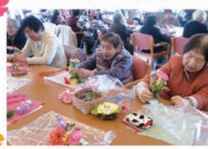
フラワー石鹸を作りました。それぞれのオリジナルシビで思いのままに 作製されていました。花のいい香りが癒されます