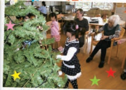
竹崎児童館からかわいい子ども たちと一緒にツリーを飾りました