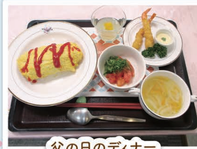
父の日のディナー