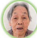
中山トキ工様 97歳 不知火町 しらぬい荘