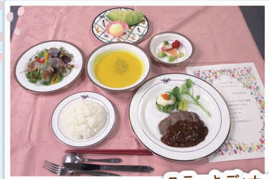
ステーキディナー