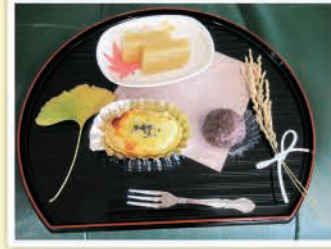
～季節の茶会話メニュー～