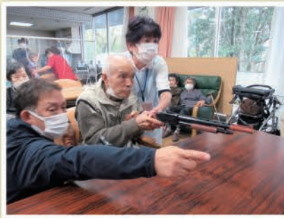
射的大会の様子 賞品ゲット