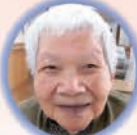
谷ロスエノ様 98歳 五木村 しらぬい荘