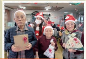
～クリスマス会の風景～