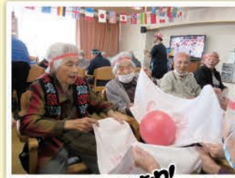
毎年恒例の スポーツ大会