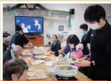
～利用者忘年会の様子～（鯛と鰯のお造り&ちゃんこ鍋）