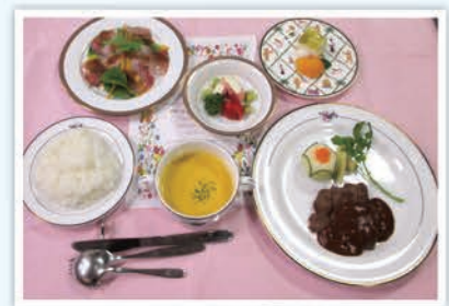
ステーキディナー