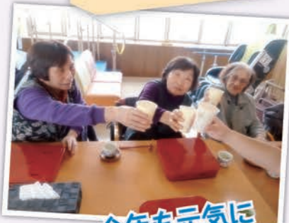
今年も元気に 過ごしましょう