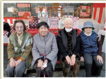
～初詣の様子～ (粟嶋神社参拝)