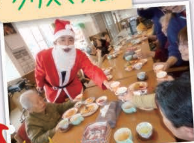
～メリークリスマス～!