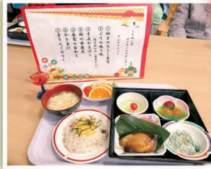
利用者新年会メニュー