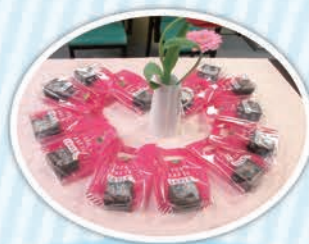
ガトーショコラ作り