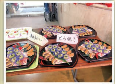
おやつバイキング