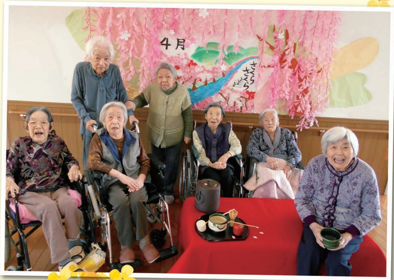
ケア4課 春のお茶会 ～しだれ桜の下で～