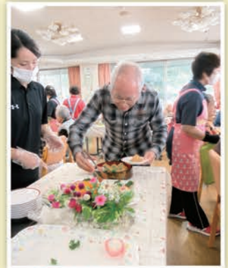
これが、おいしそうだな!