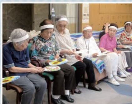
落とさないように!