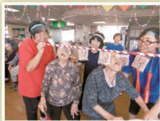
なかなか取れません~!