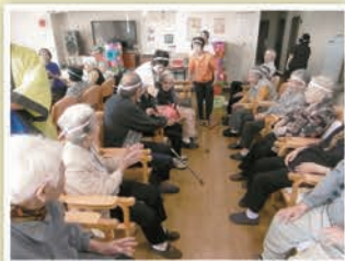
スポーツ大会の風景(みんな頑張れ~!!)