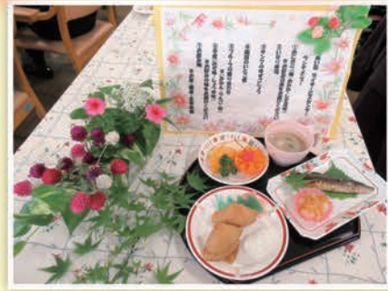
ランチバイキングメニュー