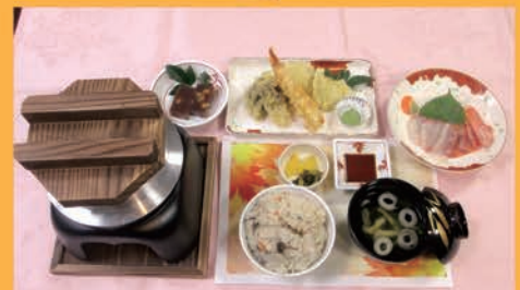
【松茸の釜めしディナー】

紅白に分かれて対戦。日頃見られない姿や必至な表情に笑顔一杯。今年も楽しい運動会でした。