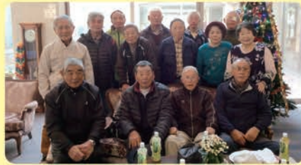
年金受給者の皆様