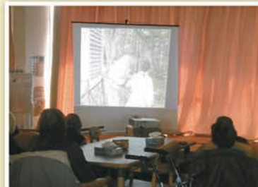
大画面での 映画鑑賞