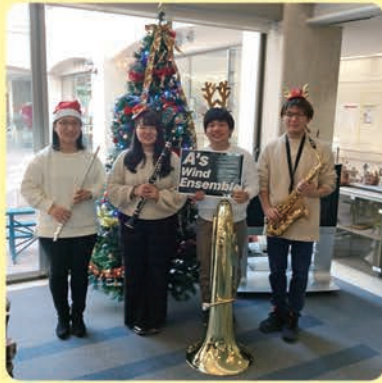
音楽ボランティアの皆様