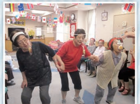
口を大きく開けて!!