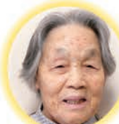
中山トキ工様 96歳 不知火町 しらぬい荘