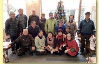
年金受給者の皆様