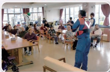
終了後、消防署職員の方から 講話を真剣に聞いています。