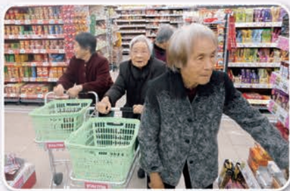
ゆめマートでお買い物中。