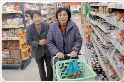
年末、年始用の買い物を 満喫中。