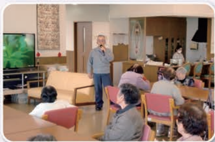
「籠の鳥」心を込めて熱唱中。