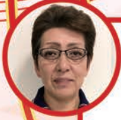
サテライト 事務職員