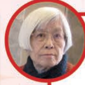
ケアハウス 下通り

皆様のご健勝とご多幸をお祈りいたします 本年もよろしくお願ひ申し上げます 2019年 元旦