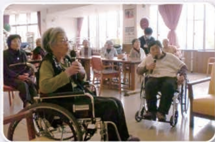
「火の国慕情」お二人で息を 合わせてデュエット。