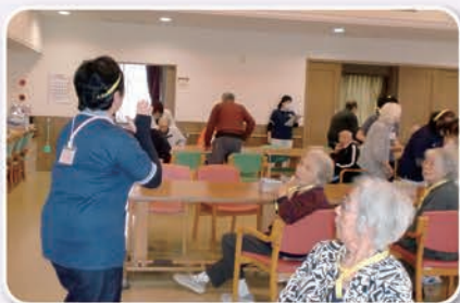
火災報知器が鳴り、 皆さん避難中!!