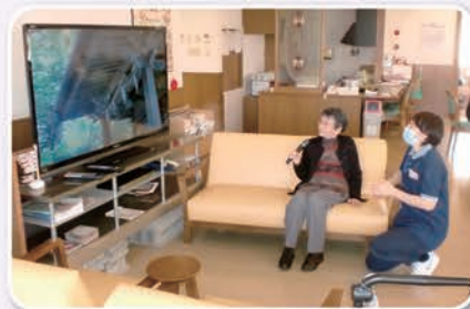
「秋月の女」優しい声で唄っています。