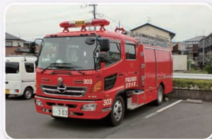
消防車が出勤しないように 火災予防に努めて下さい。