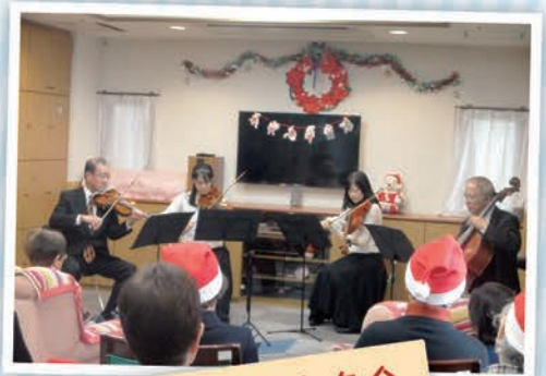
クリスマス演奏会