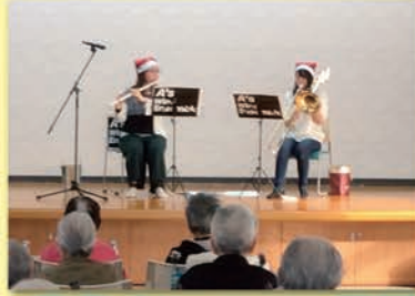
音楽ボランティアの皆様