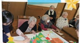
看護学生さんと クリスマスツリー作り