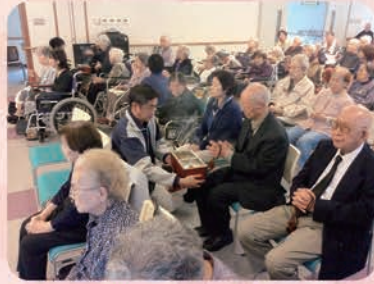
多くのご利用者に出席いただきました