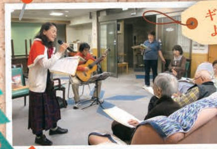
ギター演奏と歌によるクリスマス会