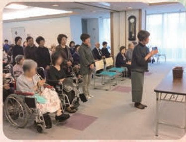
創設理事長に縁の深い方々にもご参加いただきました

福祉を取り巻く状況も厳しく、大きく変化する中、創設理事長の老人福祉に対する水光会の基本理念「人間愛」について、誓いをあらたにしました。