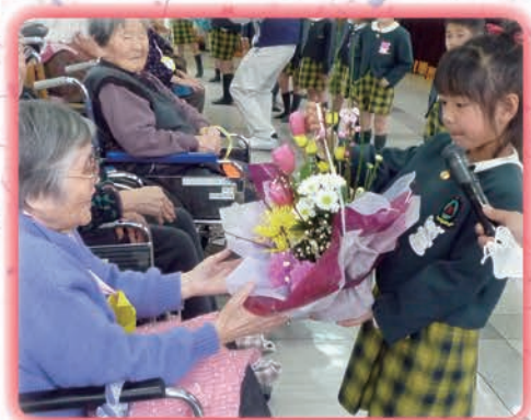
フラワーアレンジメントのプレゼント

ダンスなどの披露の後、来荘頂いた四十八名の園児さん皆で楽しいひな祭り「春よこい」の二曲を元氣よく合唱して頂きました。最後に、ご利用者の皆さんに手作りのカラフルな首飾りと花束のプレゼントがありました。参加された利用者さんはそれぞれ満面の笑みを浮かべ嬉しそうなお表情をされていました。