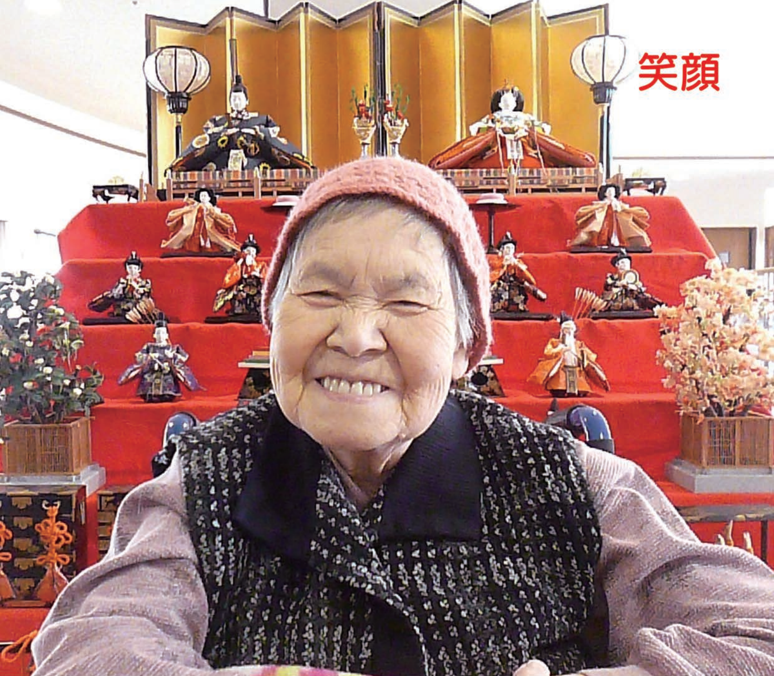
～しらぬい荘の風景～ - 2階談話ホール ひな飾り -