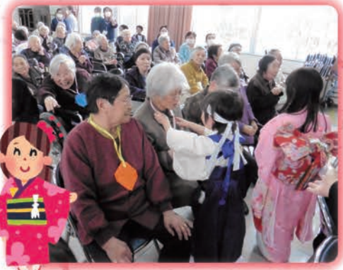
メッセージ入り首飾りのプレゼント

オープニングは「クレイジーパーティナイト」に合わせた可愛らしい踊り、続いての「花づくし」では女の子らしい日舞を、その後も傘を使った踊り、模擬刀を使った迫力の踊り等々、オリジナルのダンスや日舞などいろいろな趣向で利用者さんを楽しませていただきました。