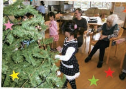
竹崎児童館からかわいい子ども たちと一緒にツリーを飾りました