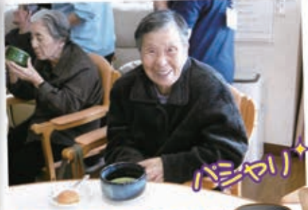
自分で点てたお茶の味は 格別に美味でした