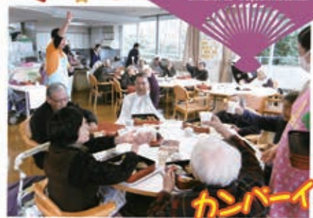
今年1年お疲れ様でした。 カンパイト