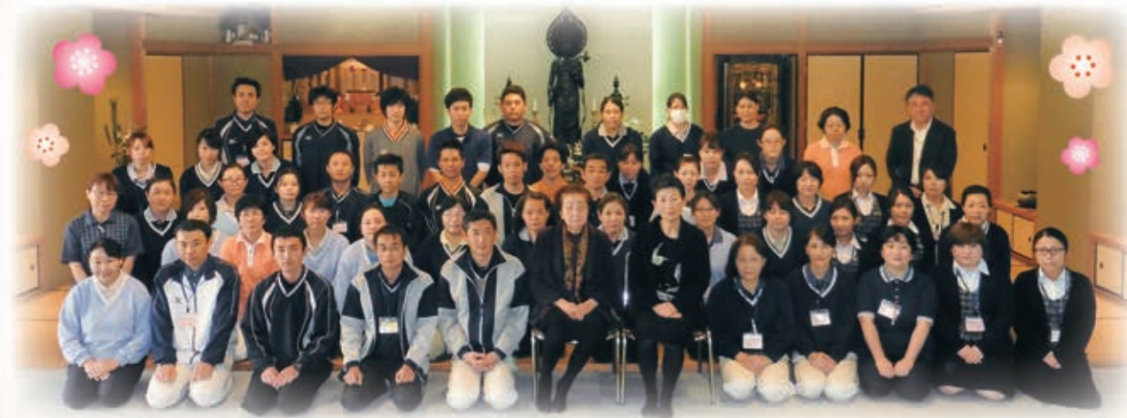
仕事始めの参加者で記念撮影

ご存知のとおり昨年四月の改正に より、特別養護老人ホームへの入所 は介護度三以上に限られておりま す。半世紀にわたり、制度改正に応 じた運営を行ってまいりましたが、 介護度三以上となりますと、待機者 の数はすいぶん減少してまいりまし た。入所などについてお困りの折は、 是非ご相談をいただきますようお願い いたします。病院と変わらなく 重度の方のご利用が増えてまいりま した。しかし、社会福祉法人の役割 は病気を治す場ではなく、暮らしを 提供するにござります。穏やかに 日々をお過ごしただけのよう、ご 利用者に寄り添うことを基本とし て今後も仕事に取り組んでまいりま す。全職員で力を合わせ、資質の向 上・専門性の向上にさらに邁進して まいります。今年も昨年同様のお力 添えをお願いいたしまして、新年の ご挨拶いたします。