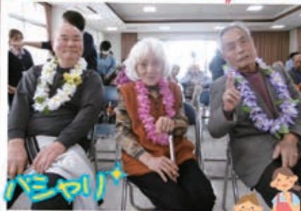
素晴らしい 歌声を披露しました