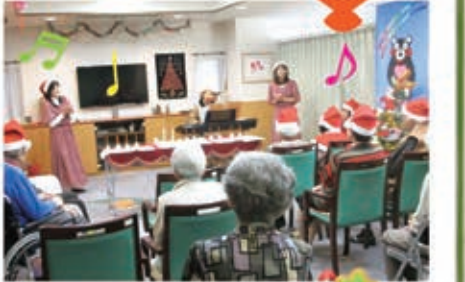
ミュージックセラピーみかん様をお招きして合同クリスマス会を行いました。 皆さん、歌ったい、踊ったい、演奏したいして、頭も身体も1つしっしょできました