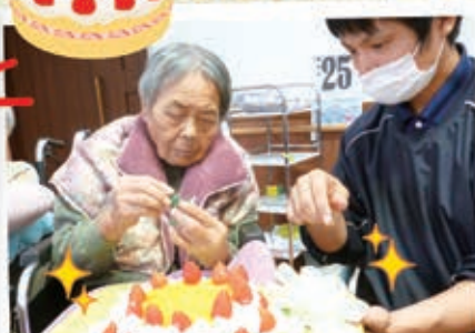
イチゴの赤色が映えまあね♪ 勿論、味も最高でした