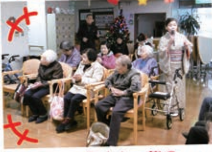
美しい歌声と一緒に みんなで歌いました