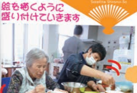
絵も柄くように 盛り付けていきます