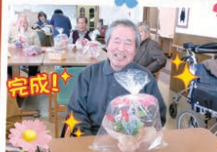
見事完成しました。 アロマな香りが安らぎます