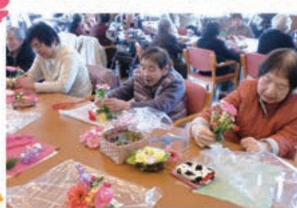
フラワー石鹸を作りました。それぞれのオリジナルシビで思いのままに 作製されていました。花のいい香りが癒されます