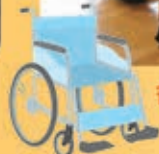
各階の車椅子を一台一台丁寧に 清掃していただきました

十二月十日、熊本県年金受給者協 会 宇城市部会の方々が十六名来荘 され、車椅子を清掃していただきま した。感謝申し上げます。