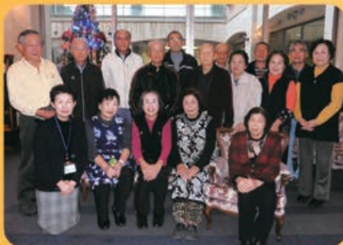
年金受給者協会 宇城市部会の皆さんで 活動後に記念撮影