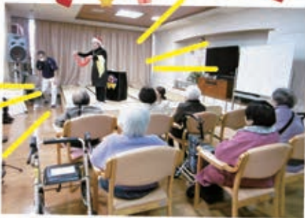
マジックショーをしてもらい 不思議なことがいっぱいでした

しらぬい荘 デイサービスセンター Shiranui-So DayServiceCenter