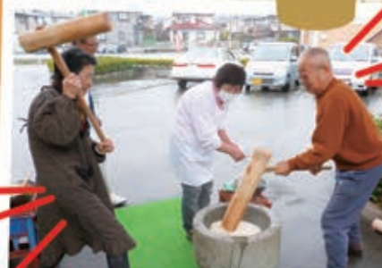
お正月に向けてベッタン餅つき♪ 完成まであと少し!