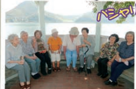
世界遺産の三角西港へ 行ってきました