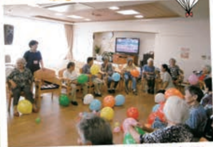
一人ひとりの風船を割り、中に入っているお題を実施しました