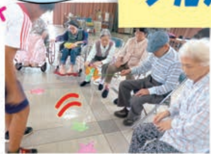
ワークキャンプの小学生と共に誕生日会と魚釣りゲームで 楽しみました。みなさん上手にできていましたよ!大盛り!大盛り!!