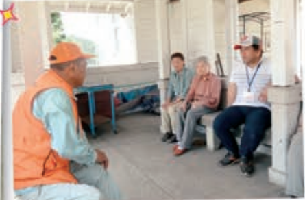
観光ボランティアガイドさんに 説明をして頂きました