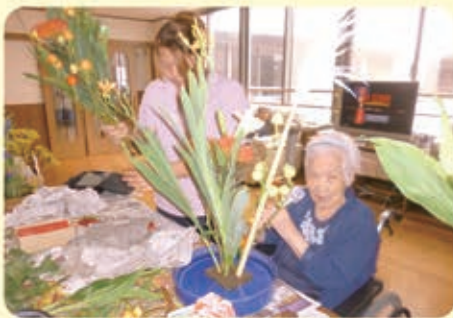
全体の色・バランスを考えながら花を活けられています