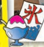
たこ焼き・かき氷・ポップコーン・金魚くいなど様々な 出店があり皆さん楽しまれていたようです