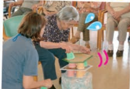
みんなに負けてられん! 今日の私はやるはい!!