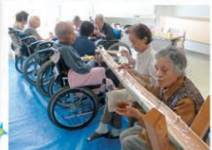
流れてくるソーメンをつかむのは難しいですね♪ 皆さん楽しみながらおいしく頂きました