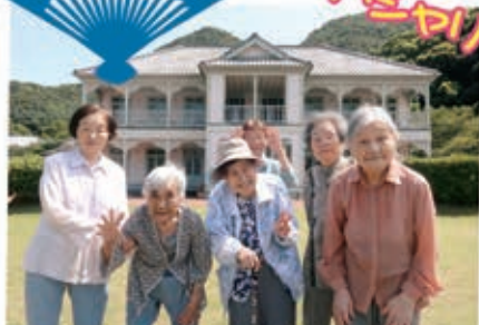
小泉ハ雲が立ち寄ったとされる 蒲島屋をバックに記念撮影♪