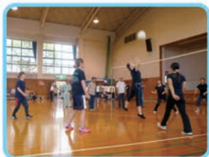
白熱のミニバレーボール

九月六日、希望の里サン・アピリティーズで竹崎区健康づくり体育祭が開催されました。今回、竹崎地区の地域住民の方々が清香園、しらぬい荘の職員が参加し、競技を通じて交流を深めました。競技中は地域の方々から温かい声援もあり、参加できたことに感謝を申し上げます。