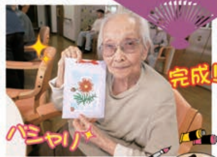
お一人おひとりが自分好みの色もつけてきれいに つくることができ満足です!