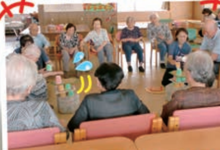
倒さないとれだけたくさん先に 積み上げられるか競いました♪