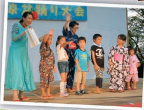
子供達が「じゃんけん大会」に参加