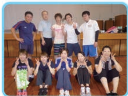
しらぬい荘の参加メンバー

①92歳 ②松橋町 ③家族の面会時、ゆっくり色々な話をする事がとても楽しみです。これからも元気に楽しく過ごして行きたいです。