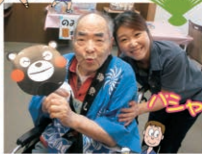
毎年恒例の合同夏祭りを行いました!お神輿の披露で大盛り上がり! みなさん祭りを堪能されました