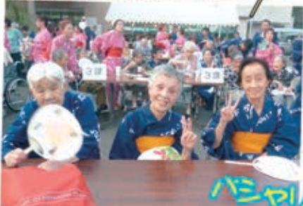
しらぬい荘盆踊り大会に 参加し、たのしみました