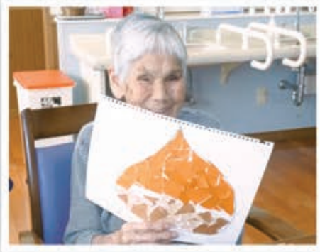
ちぎり絵の完成にご満悦

完成した絵は、ユニット内に飾っています。これから、たくさんちぎり絵に取り組み充実した日々を過ごしていきたいと思います。