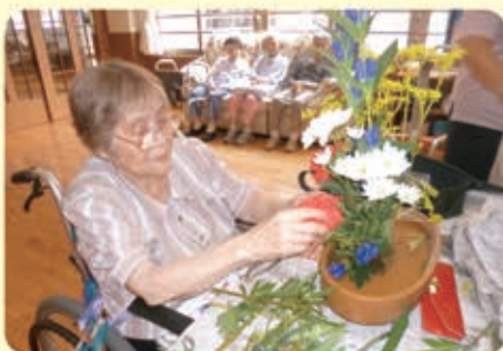
慣れた様子で、スムーズに花を活けられています