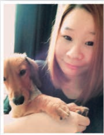
愛犬(ダックスフンド)と一緒に撮影

私が小学生の時に、実習で介護施設に行つたのですが、その施設では、セラピー犬として犬を二匹飼っておられました。二匹ともとてもおとなしく、利用者の方々を笑顔にし癒しを与えていました。その時は、一緒にいるだけで笑顔にしてくれる動物の力はすごいなと思いました。皆さんも動物と触れ合う機会がありましたら是非元気をもらって下さいね。