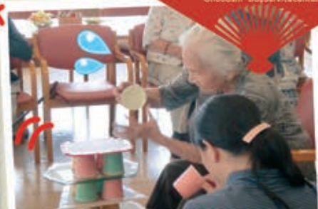
倒さないように慎重に・・・ 集中力が大切です!

大野橋 デイサービスセンター Onobashi DayServiceCenter