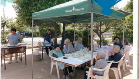
この日は五月晴れで、外で食べる昼食は一層おいしいです