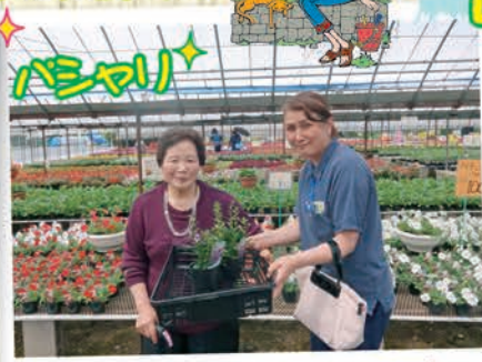
きれいな花を見るとついつい置いたくないです