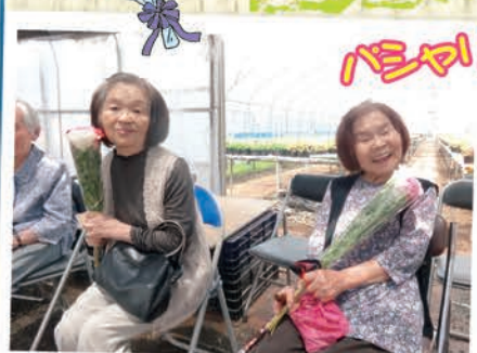
農園開放に合わせて、きれいな花々を観に行きました