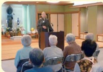
皆さん真剣にお話に耳を傾けられていました