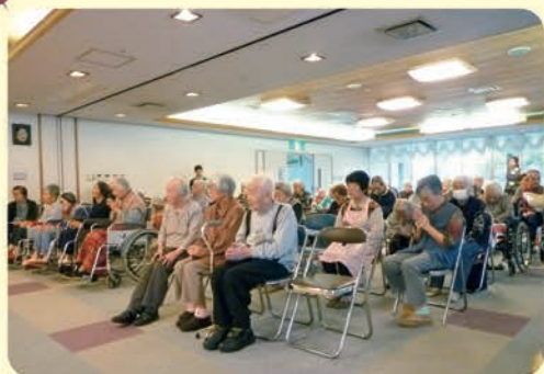
皆さんがいつまでも元気で過ごされますようにとお経を唱えられました

陰暦の正五九月にあたる、一月、五月、九月にはしらぬい荘の建物の周りをお酒と米塩で御被りして頂きます。