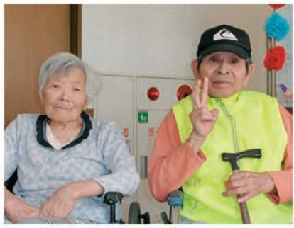
ご夫婦と一緒に記念撮影

これからは、病気などせずに美味しい食事をしっかりと食べて、妻と一緒に楽しい生活を送っていききたいと思っています。来年も、このような素晴らしい会に参加したいと思っています。