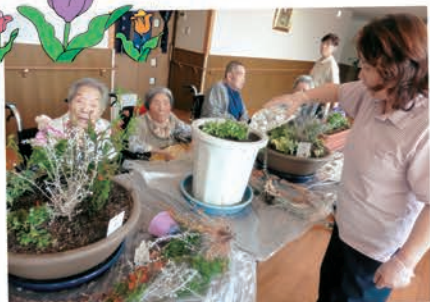
たくさんの花を植えてきれいに 飾り心も明るくなりました