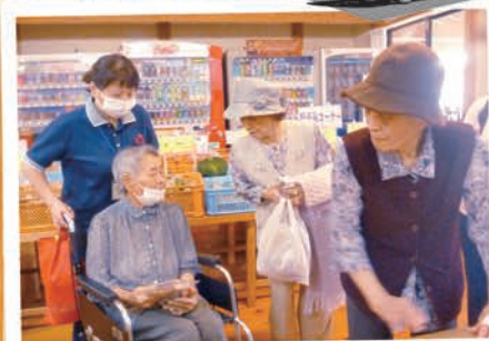
なごみ温泉バスハイクに行ってきました