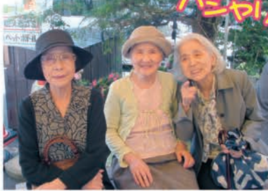
藍の天草村にて♪ たくさんの特産物があり面白い物を楽しみました!