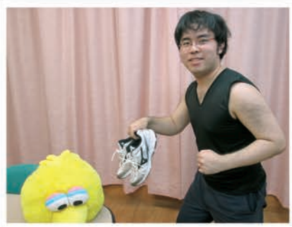
愛用のシューズを履いて、これからランニングに行きます