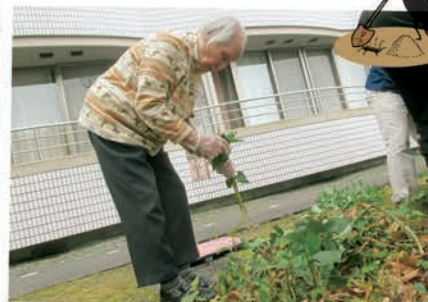
太陽の日差しに負けず、屋外での 園芸活動に取り組まれました