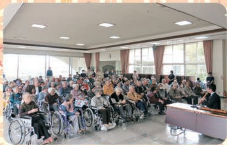
100名余りの方が参加されました