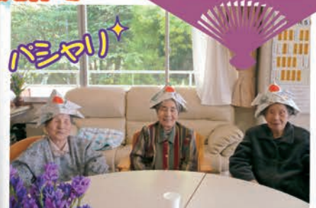
身の安全と健康を願って兜を作りました