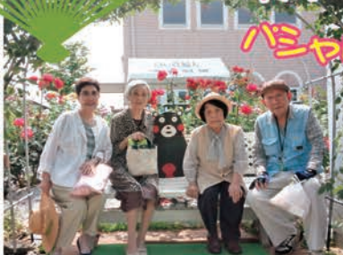
西区のフードパルへ薔薇見学に行きました。お天気にも恵まれ、 美味しいお茶も頂き皆さん大変喜ばれていました