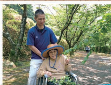
枝にたくさんの梅がなっていました

平成二十七年五月二十七日、しらぬい荘玄関前の並木坂にて梅ちぎりを実施しました。 毎年、五月の下旬に利用者様と職員でたくさんさんの梅を収穫しています。今年は、多くの利用者様