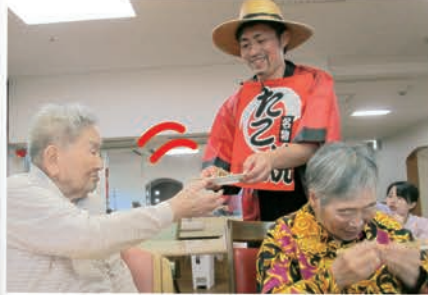
出来たてあつあつのたこ焼きは とても美味しかったです