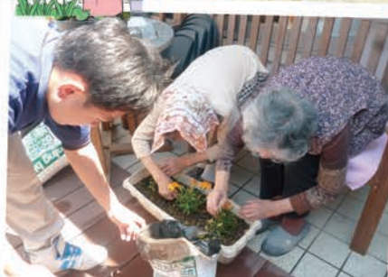
丁寧に苗を植えました。今後綺麗な花に育っていくのが楽しみです♪