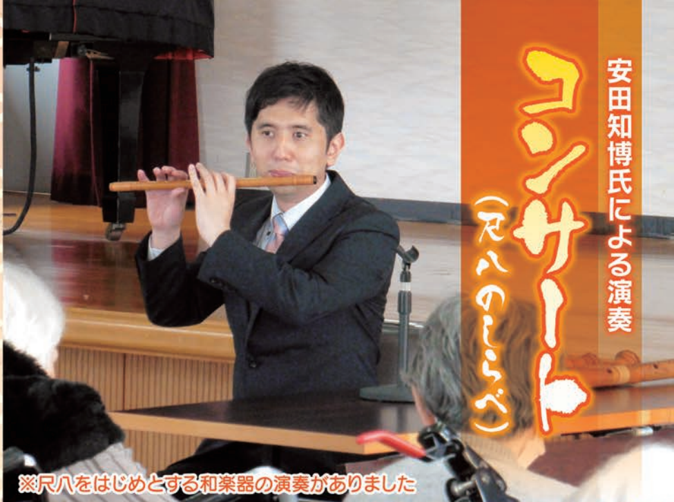
※尺八をはじめとする和楽器の演奏がありました