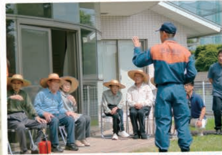
職員も一緒に熱心に説明を聞き、消火器について学びました!