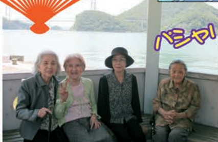
潮の香りはいつもとちがう感じて いい気分転換になりました♪