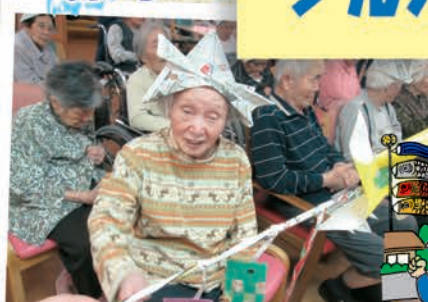
兜をつけ勇ましい飾りをして 男の子の誕生と成長を祝いました!