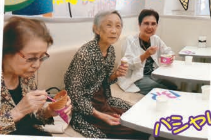
下通りのサーティーワンです。 暑い日にはアイスが最高!