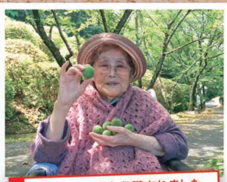
たくさんの梅を収穫されました