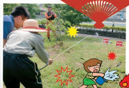
火事を想定し放水体験を行いました。無事に消火完了!!