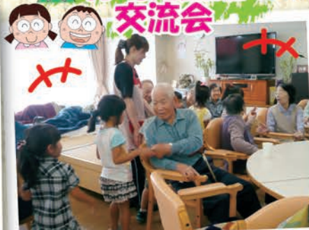
元気いっぱいの子童さんと一緒に過ごしてみんな笑顔でした