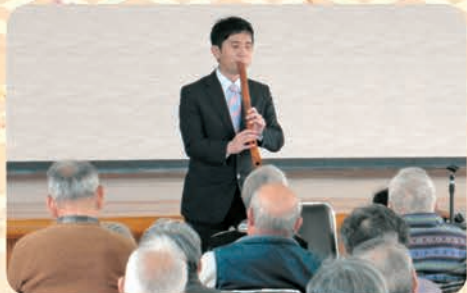
尺八の心地よい音色を奏でられています