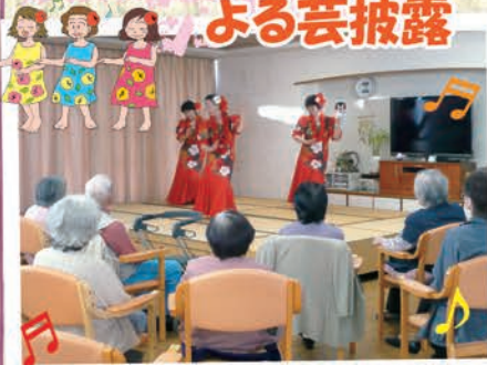
陽気でリズムがちなフラダンスをみて、みなさんハッピーです♪