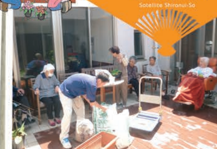
小スペースでも楽しめるガーデニングにトライしてみました♪