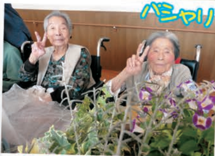
みなさんきれいに花を植える ことができ大満足でした