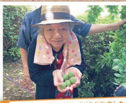
2年連続で梅ちぎりに参加されました