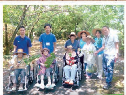
収穫を終え、記念撮影を行いました