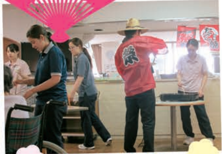
こがさないように、丁寧にやきました!